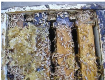
Abb. 1: Von Käferlarven zerstörtes starkes Volk

Der Kleine Beutenkäfer ( Aethina tumida ) ist ein gefürchteter Schädling von Völkern sozialer Bienen (Honigbienen, Hummeln und stachellose Bienen), dessen adulte Käfer und Larven Honig, Pollen und bevorzugt Bienenbrut fressen. Die europäischen Länder sowie die Schweiz galten bislang als frei vom Kleinen Beutenkäfer. Aktuelle Meldungen vom September 2014 über Funde von Aethina tumida in Süditalien sind alarmierend und verlangen auch von Schweizer Imkerinnen und Imkern erhöhte Aufmerksamkeit und die regelmässige Kontrolle der eigenen Bienenvölker.