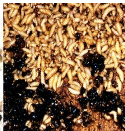
Abb. 4 a-c: a) erwachsener Kleiner Beutenkäfer (links), im Grössenvergleich zu Bienen (b) und c) Larven des Käfers.

Neben den Funden von Käfern, Larven und Eiern kann man einen Befall an Fressgängen in den Waben, Verschleimung der Honigwaben, vergorener, faulig riechender, verflüssigter Honig oder an verkrusteten Kriechspuren der Wanderlarven aussen am Bienenstand erkennen.