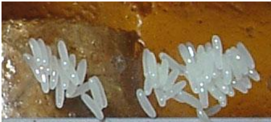
Abb. 2: Eigelege des Kleinen Beutenkäfers

Larven: Die Larve ist das für das Bienenvolk und gelagerte Imkereimaterial schädliche Entwicklungsstadium. Sie wird bis ca. 1 cm lang, ist creme-farben und könnte auf den ersten Blick mit der Larve der Wachsmotte verwechselt werden (siehe Abb. 2). Bei näherer Betrachtung ist sie jedoch durch ihre 3 Vorderbeinpaare (a), Stachelborsten auf dem Rücken jedes Körpersegments (b) und zwei große Dornfortsätze am hinteren Ende (c) leicht von dieser zu unterscheiden.