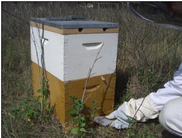
Abb. 5: die Plastikstreifen werden durch das Flugloch in die Beute geschoben und nach >12 Std. schnell entfernt und in eine Tüte geschlagen. Die erwachsenen Käfer verstecken sich bevorzugt in diesen Fallen.

Bei jeder Völkerkontrolle ist auf das Brutbild zu achten. Beim Auffinden von verdächtigen Käfern oder Larven sollen sich Imkerinnen und Imker an ihren Bieneninspektor wenden, welcher nach Rücksprache mit dem Zentrum für Bienenforschung (ZBF) Proben zur Untersuchung einsendet. Proben können leicht mit Schäfer-Diagnose-Streifen genommen werden (siehe Abb. 5):